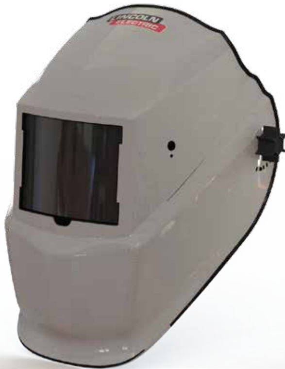
RF506082 SILVER SPARK