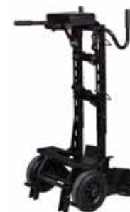
CART 24 K14191-1