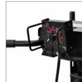
Soporte para el mando a distancia