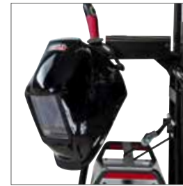
Porta Pantalla de soldadura