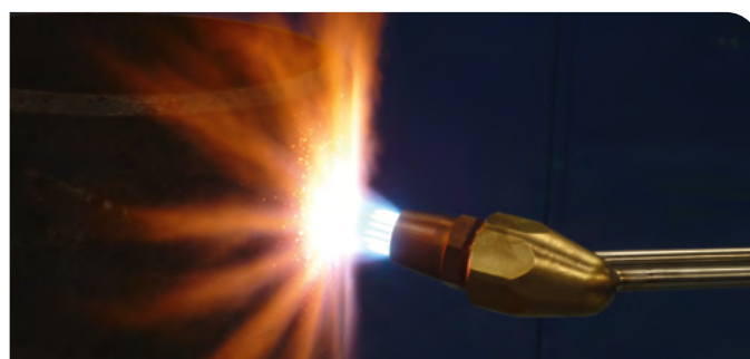
Chauffe avec buse multidard