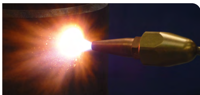
Chaude de retrait avec buse monodard