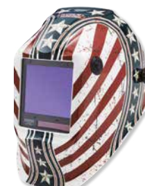
VIKING™ 3350 Dardevil