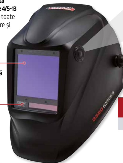
VIKING™ 3350 BlackMat