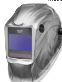
VIKING™ 2450 Heavy Metal®

Performanță superioară în exterior pentru utilizare în toate mediile