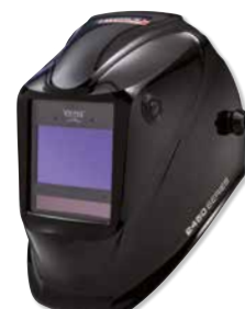
VIKING™ 2450 Black

CONTINUT PACHET Se livrează cu geantă pentru mască, bandană, 5 lentile de acoperire exterioare, 2 lentile de acoperire interioare și folie autocolantă.