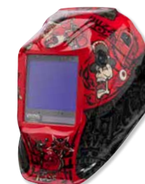
VIKING™ 3350 Mojo™