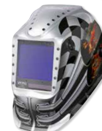
VIKING™ 3350 Motorhead™

Butonul de polizare extern îngropat asigură tranziția fluentă între modurile de sudare și polizare