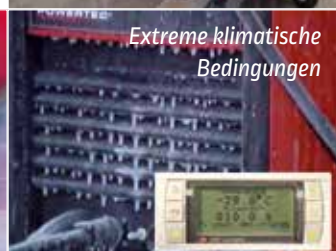
Extreme klimatische Bedingungen