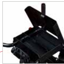
Ablagefach für Kleinteile und Werkzeuge