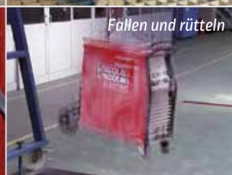
Fallen und rütteln