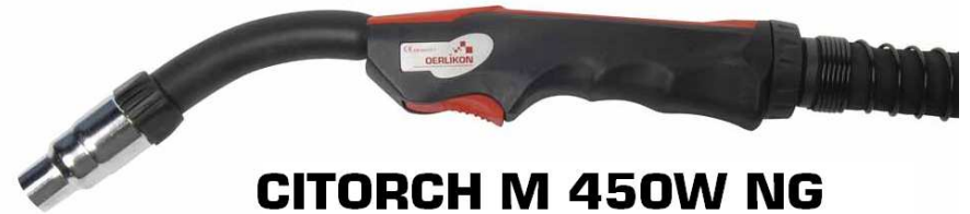
CITORCH M 450W NG