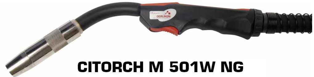
CITORCH M 501W NG

INSTRUCTION DE SECURITE, D'UTILISATION ET DE MAINTENANCE INSTRUCTIONS FOR SAFETY, USE AND MAINTENANCE BETRIEBS- WARTUNGS- UND SICHERHEITSANLEITUNG ISTRUZIONI PER LA SICUREZZA NELL'USO E PER LA MANUTENZIONE INSTRUCCIONES DE SEGURIDAD, EMPLEO Y MANTENIMIENTO INSTRUÇÕES DE SEGURANÇA, DE UTILIZAÇÃO E DE MANUTENÇÃO INSTRUKTIONER FÖR SÄKERHET, ANVÄNDNING OCH UNDERHÅLL VERBRUKSONDERDELEN INSTRUCȚIUNI DE PROTECȚIE, DE EXPLOATARE ȘI DE ÎNTREȚINERE PREDPISY JEHO POUŽÍVANIA A ÚDRŽBY INSTRUKCJA BEZPIECZEŃSTWA, OBSŁUGI I KONSERWACJI INSTRUKTIONER FOR SIKKERHED, BRUG OG VEDLIGEHOLDELSE ИНСТРУКЦИЯ ПО ТЕХНИКЕ БЕЗОПАСНОСТИ, ЭКСПЛУАТАЦИИ И ТЕХНИЧЕСКОМУ ОБСЛУЖИВАНИЮ