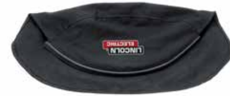
PROTECCIÓN MAXIMIZADA DE ALGODÓN IGNÍFUGO

LINCOLN ELECTRIC Protección maximizada de algodón ignífugo para la cabeza con ajuste de silicona a presión.