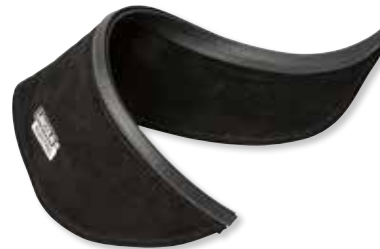
PROTECTOR CUELLO DE CUERO PIEL FLOR PARA PANTALLA DE SOLDADURA