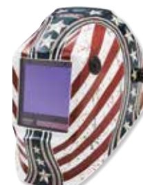
VIKING™ 3350 Dardevil