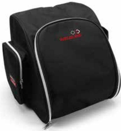
MOCHILA PARA PANTALLA DE SOLDADURA