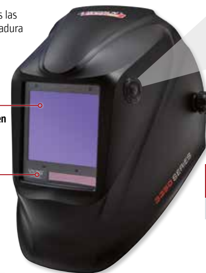
VIKING™ 3350 BlackMat