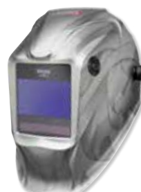
VIKING™ Heavy Metal®

Rendimiento superior en exteriores para su uso en cualquier entorno