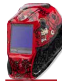
VIKING™ 3350 Mojo™