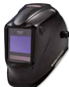
VIKING™ 2450 Black

INCLUYE: – Viene de serie con bolsa para la pantalla, pañuelo, 5 lentes de cubierta exterior, 2 lentes de cubierta interior y adhesivos.