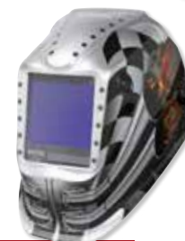
VIKING™ 3350 Motorhead™