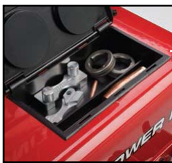
Compartimento para consumibles de la pistola y del alimentador.