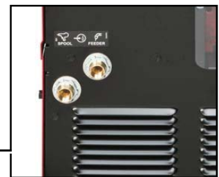
Solenoido adicional de gas – Controla el flujo para las Spool Gun.