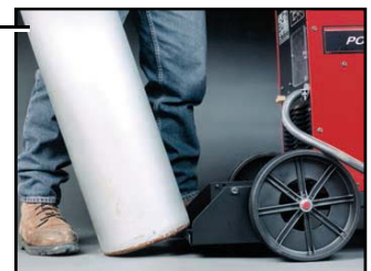
Plataforma de cilindro de gas para una fácil montaje.