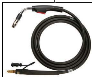
Pistola Magnum® PRO 250L con puntas de contacto de Copper Plus™

Agrega el bloqueo de gatillo de 4 pasos, modo de punteo, velocidad de inicio ajustable para inicio mas suave del arco y tiempo de quemado en retroceso ajustable para minimizar el pegado del alambre en el charco de soldadura.