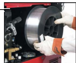
Fácil montaje del alambre en su compartimento.