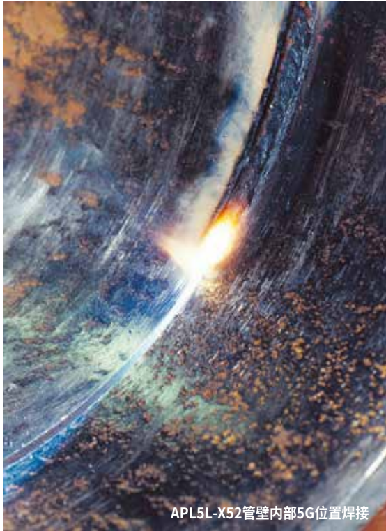
APL5L-X52管壁内部5G位置焊接