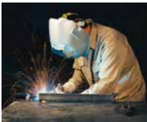
传统的恒压短路过渡模式 使用的是二氧化碳保护气及0.045 英寸实心焊丝

STT®工艺是一种受控的MIG短路过渡工艺，使用电流调节来控制热输入，而不影响送丝速度，从而产生优越的电弧性能，良好的熔深，低热输入，减少飞溅和烟尘。（更多信息请参照Nextweld资料NX-2.20）