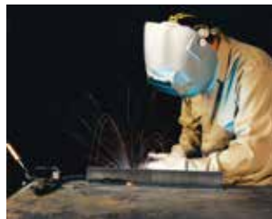
STT®过渡模式 使用的是二氧化碳保护气及0.045英寸 实心焊丝