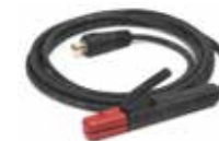
SCHWEISSKABEL MIT ELEKTRODENHALTER (KLEMME) E/H-300A-50-5M