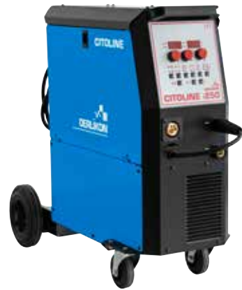
CITOLINE i250 250A@35%