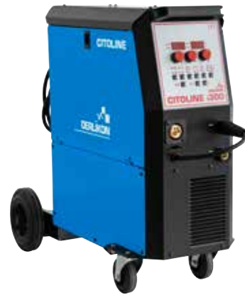
CITOLINE i300 300A@35%