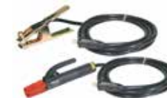
E-HAND- SCHWEISSSETS W000260683 W000011139