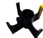
ADAPTER FÜR SPULE TYP B300 K10158-1