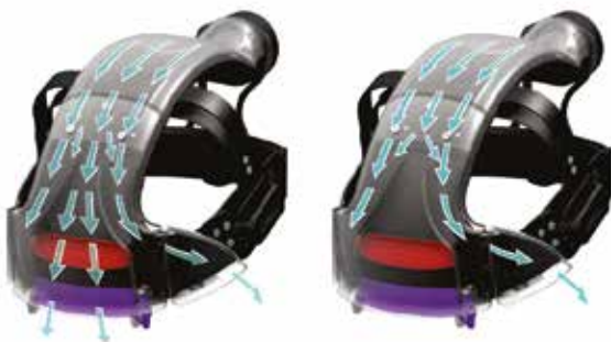
Erste Ablenkung (rot): Verteilung des Luftstroms auf Stirn und Schläfen

Zwei Ablenkvarianten zur Einstellung des Luftstroms: maximaler Komfort und Schutz der Augen vor Austrocknung.