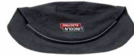
FLAMMHEMMENDE BAUM- WOLLE FÜR MEHR SCHUTZ

LINCOLN ELECTRIC Flammhemmende Baumwolle für besseren Kopfschutz, aufpressbarer Silikonverschluss