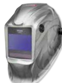
VIKING™ Heavy Metal®

Hervorragend geeignet für Arbeiten im Freien in allen Umgebungen