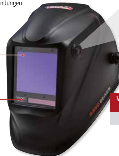
VIKING™ 3350 BlackMat