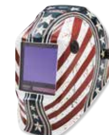
VIKING™ 3350 Dardevil