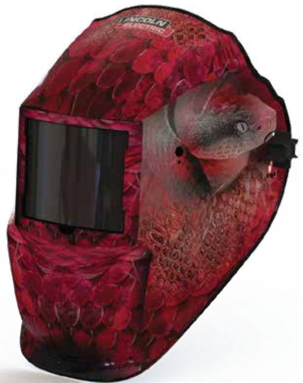
RF506083 VIPER SKIN

PARA MEJORES RESULTADOS DE SOLDADURA CON EQUIPOS LINCOLN ELECTRIC, SIEMPRE USE CONSUMIBLES DE LINCOLN ELECTRIC. VISITE www.lincolnelectric.com.mx PARA MÁS DETALLES