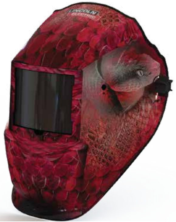
RF506083 VIPER SKIN

FOR BEST RESULTS FROM LINCOLN ELECTRIC WELDING EQUIPMENT, ALWAYS USE OF LINCOLN ELECTRIC SUPPLIES. VISIT www.lincolnelectric.com.mx FOR MORE DETAILS