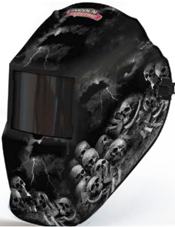
RF506081 SKULL WALL