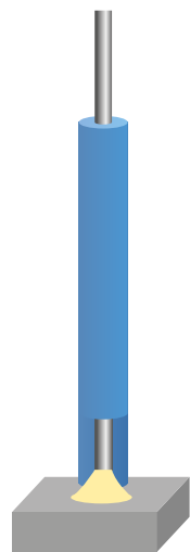
Arc moins concentré