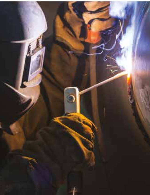
Électrode enrobée standard