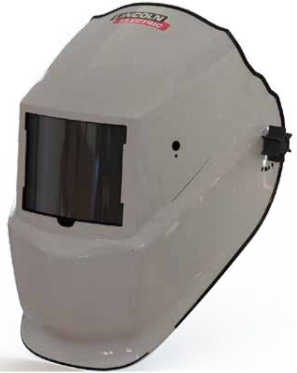
RF506082 SILVER SPARK

FOR BEST RESULTS FROM LINCOLN ELECTRIC WELDING EQUIPMENT, ALWAYS USE OF LINCOLN ELECTRIC SUPPLIES. VISIT www.lincolnelectric.com.mx FOR MORE DETAILS