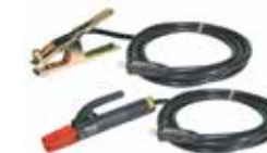
E-HAND- SCHWEISSSETS W000260683 W000011139