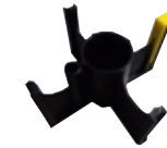
ADAPTER FÜR SPULE TYP B300 K10158-1