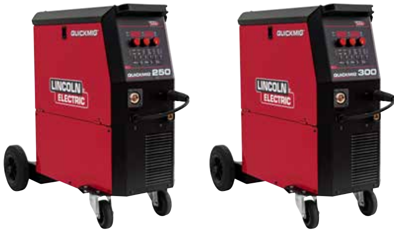
QUICKMIG® 250 250A@35%