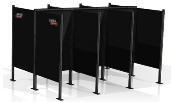
Espalda con espalda

Para comenzar a diseñar su laboratorio de soldadura o centro de capacitación, consulte la página siguiente o visite https://www.lincolnelectric.com/en/Welding-and-Cutting-Resource-Center/Weld-Fume/How-to-get-started-Weld-booths-and-welding-stations