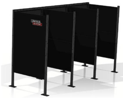
Lado a lado