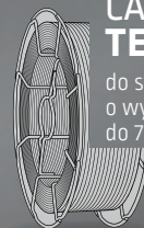
CARBOFIL TENSIMAX 79