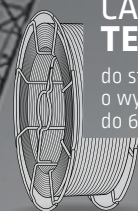
CARBOFIL TENSIMAX 69

Tylko odpowiednio opracowane materiały dodatkowe mogą zapewnić metalurgiczną i technologiczną integralność złącza w tak wymagających warunkach.