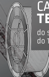
CARBOFIL TENSIMAX 89

do stali o wytrzymałości do 1100 MPa i więcej