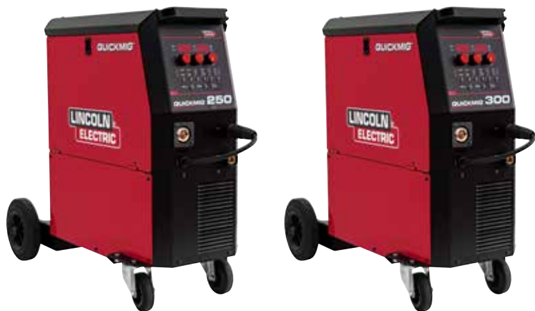
QUICKMIG® 250 250A@35%