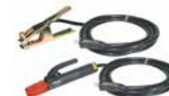
KIT MMA W000260683 W000011139