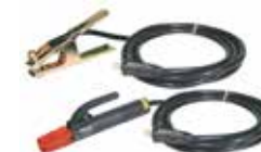
KITS ARC W000260683 W000011139