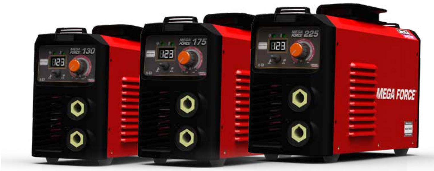
Mostrado: MEGA FORCE 225 – K69069-1