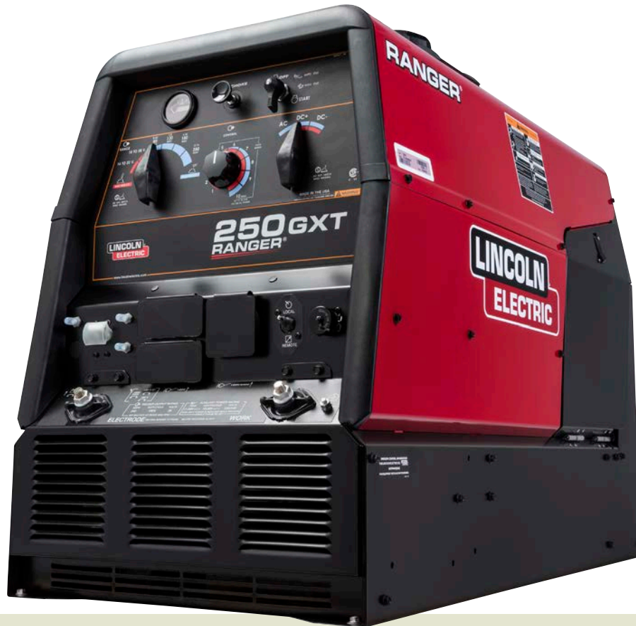
Se muestra: Ranger 250 GXT, K2382-4