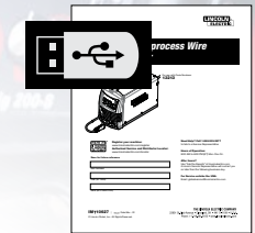
MANUAL DE INSTRUCCIONES en USB