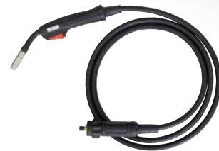
PISTOLA MIG, EURO 3m 150A@35% [200A@20%]