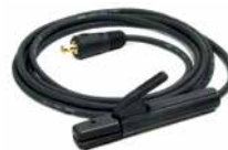
CABLE DE SOLDADURA CON PORTAELECTRODOS 3m